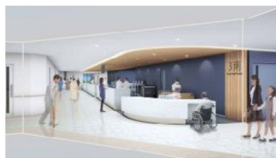
2F スタッフステーション