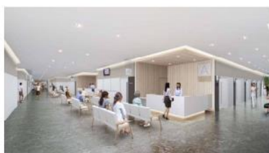
1F 外来ブロック受付